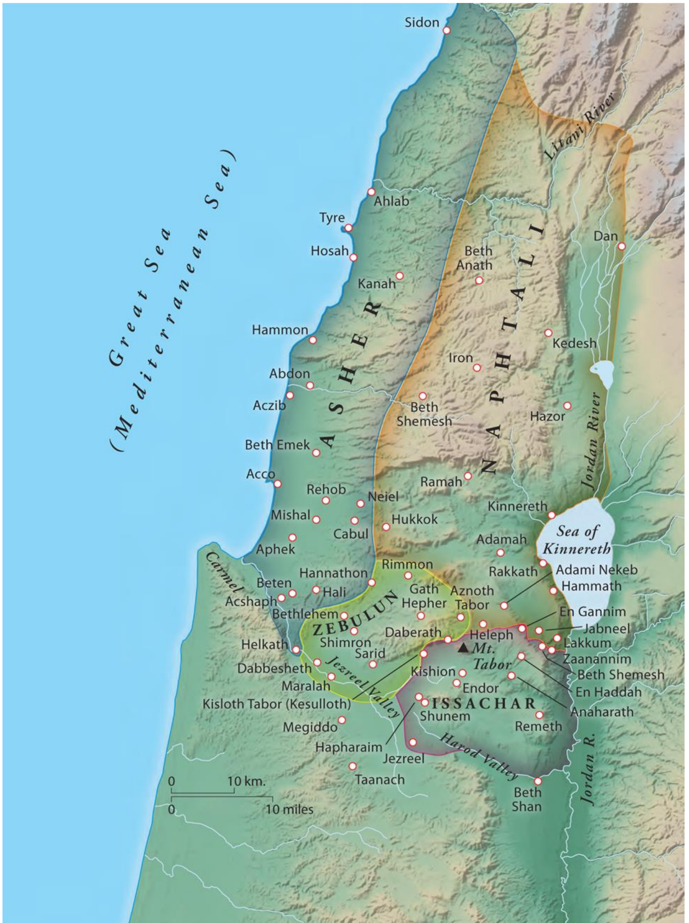
© Zondervan Atlas of the Bible, 2010